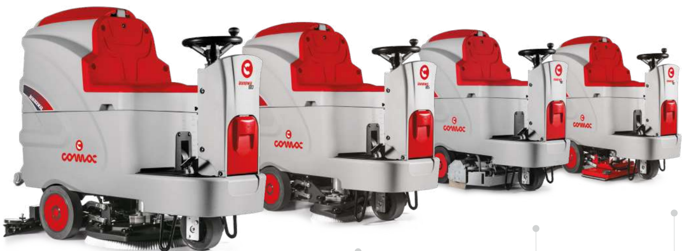
INNOVA 60 Versión con un cepillo de disco