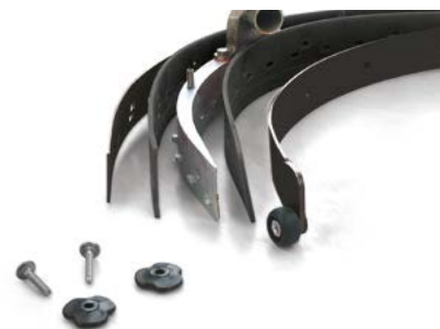
Vispa 35 E-B-BS Para obtener un buen secado, siempre se deben mantener limpias las gomas de la boquilla de aspiración. La sustitución de las mismas en caso de desgaste resulta sumamente sencilla