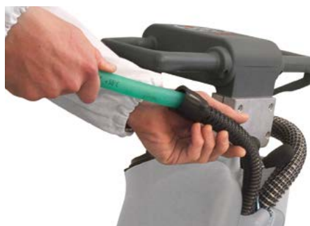
Vispa 35 B-BS Limpieza periódica del tubo boquilla de aspiración para garantizar una aspiración eficiente