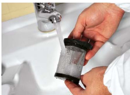
Vispa 35 E-B-BS Limpieza total del filtro de aspiración simple y práctica