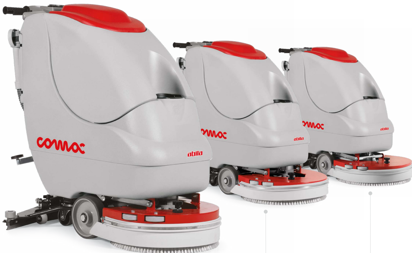
Abila 17 B/BT Versión fregadora con cepillo de disco