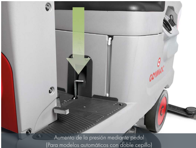
Aumento de la presión mediante pedal (Para modelos automáticos con doble cepillo)