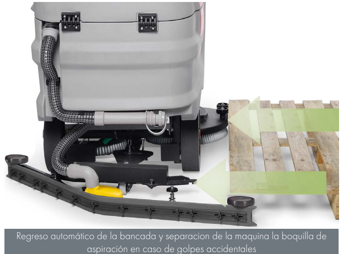
Regreso automático de la bancada y separación de la máquina la boquilla de aspiración en caso de golpes accidentales